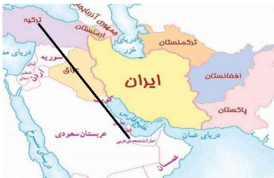
شکل ۱. موقعیت جغرافیایی ترکیه و امارات متحده عربی نسبت به یکدیگر

در این پژوهش، در چهارچوب نظریه وابستگی متقابل، کوشش می‌شود نشان داده شود که ترکیه با یک رویکرد مبتنی بر استفاده از قدرت نرم در عرصه اقتصاد، پیشبرد اهدافی همچون تقویت روابط اقتصادی و دسترسی به بازارهای منطقه‌ای، گسترش فرهنگ ترکی در منطقه خلیج فارس و کاهش سطح نفوذ ایران و عربستان سعودی را دنبال می‌کند. این پژوهش از آنرو اهمیت دارد که در قالب پژوهش‌های انجام‌شده در حوزه مطالعات منطقه‌ای در ایران، تا کنون به آن پرداخته نشده است و از آنرو ضرورت دارد که با تبیین و شناخت رویکرد ترکیه درباره امارات متحده عربی، سیاست‌گذاری‌ها در حوزه دیپلماسی اقتصادی در ایران ارتقای بیشتری یابند.