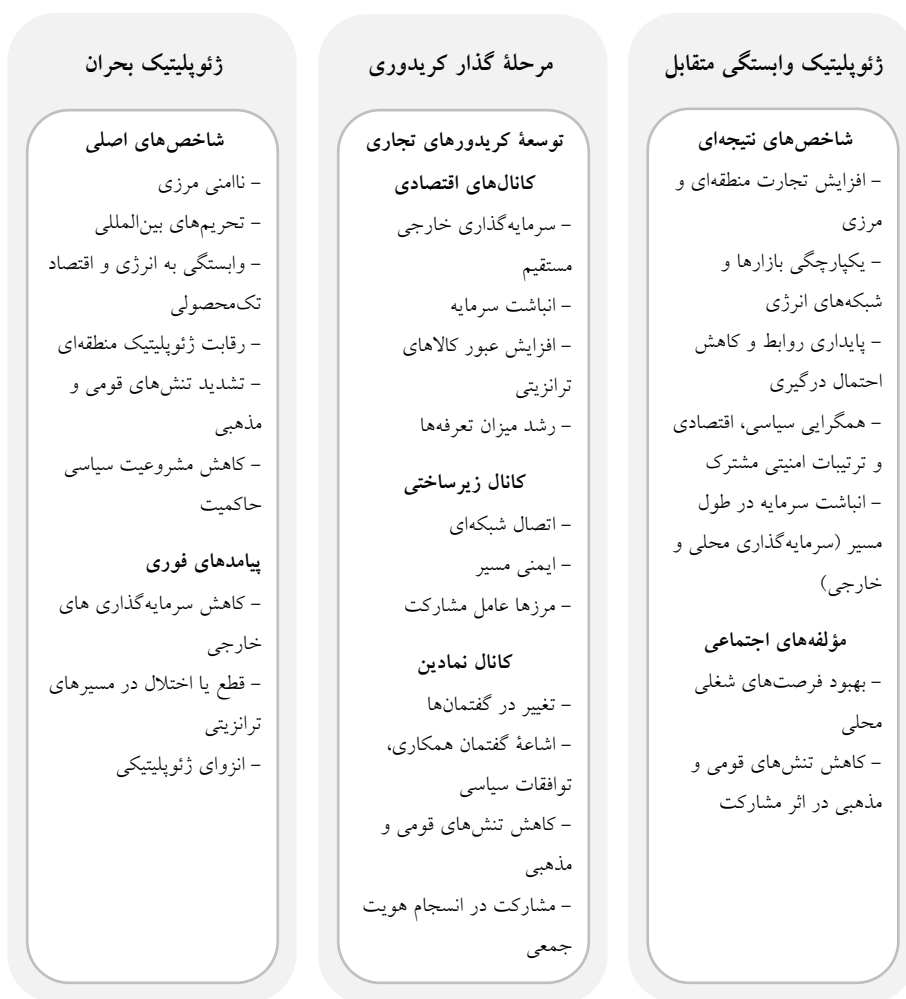
نمودار ۱. مدل گذار کریدوری

توسعه با بهره‌گیری از منافع اقتصادی، همکاری‌های امنیتی و منطقه‌گرایی، می‌تواند عراق را از یک کانون بحران به یک مرکز همکاری منطقه‌ای تبدیل کند.